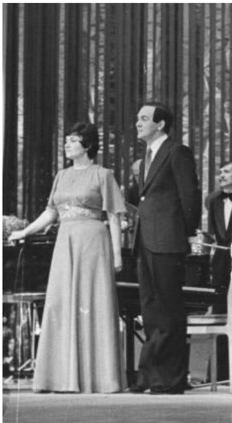
Фото калужских концертов с сайта muslimmagomaev.ru