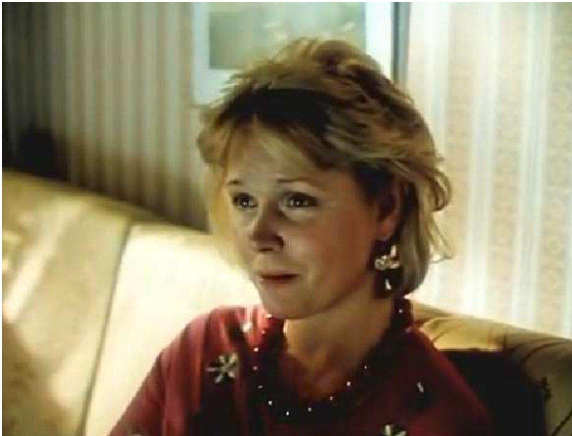
«Артистка из Грибова»